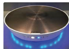
状态: 已连接蓝牙设备